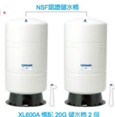
XL600A 標配 20G 儲水桶 2 個