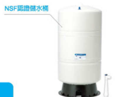
XL300A 標配 20G 儲水桶 1 個

如欲節省空間可直接輸出不必儲水桶，則每分鐘純水出水量約2公升，關出水龍頭立即停機。