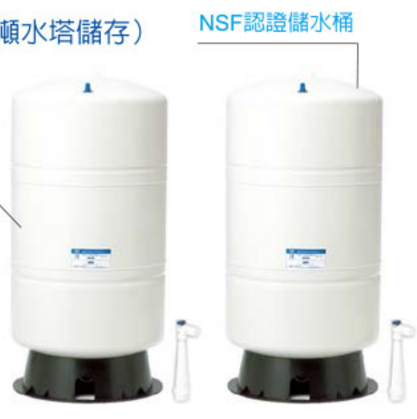
XL600A 標配 20G 儲水桶 2 個

如欲節省空間可直接輸出不必儲水桶，則每分鐘純水出水量約 2 公升，開出水龍頭立即停機。