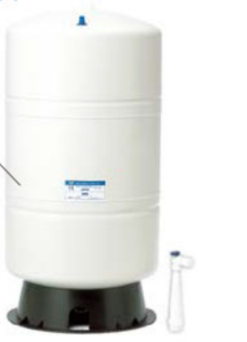
XL300A 標配 20G 儲水桶 1 個