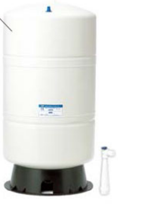
RO 200 標配 20G 儲水桶 1 個