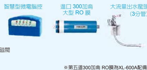
*第五道300加侖 RO膜為XL-600A配備

△ 如欲節省空間可直接輸出不必儲水,則每分鐘純水出水量約 2 公升,關閉出水龍頭即停機。