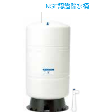
NSF認證儲水桶 XL300A 標配 20加侖儲水桶 1 個