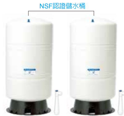
NSF認證儲水桶 XL600A 標配 20加侖儲水桶 2 個